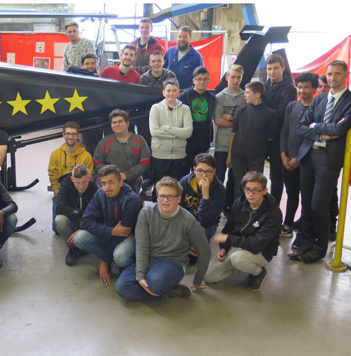
Les lycéens de Baumont sont très fiers du travail accompli et verront sans conteste partir leur hélicoptère avec un pincement au cœur.