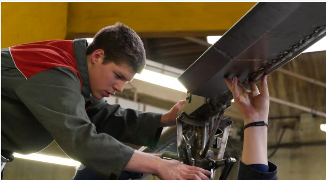
Construire cet hélicoptère a demandé beaucoup de réflexion mais aussi de la manutention. Comme au moment de porter les pales à bout de bras.