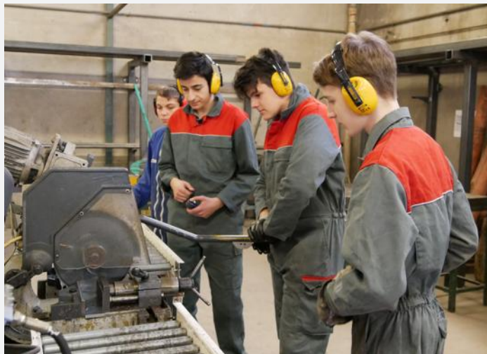
Chaque élève a pu participer à la construction du projet. Notamment en coupant les pièces.