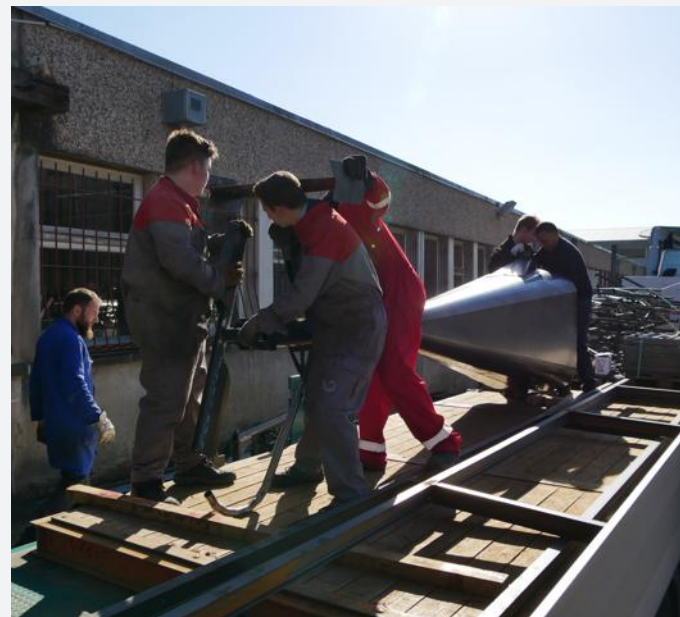
Une des dernières étapes : le départ pour la galvanisation assurée par une société d'Anould, partenaire comme trois autres.